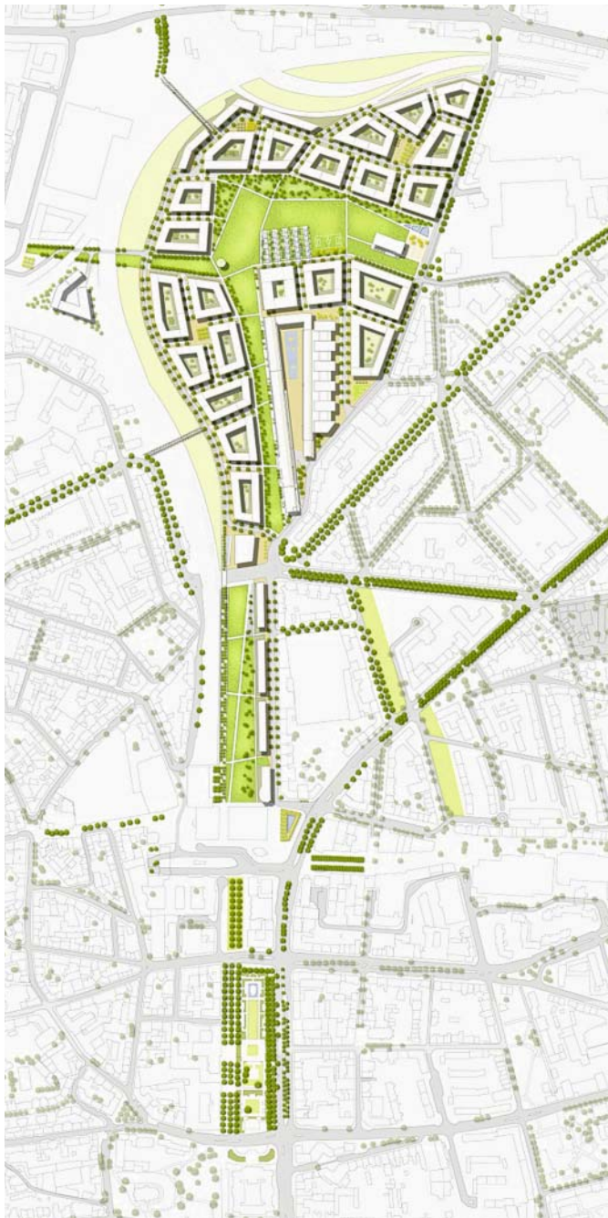
Abb. 1: Masterplan Mitte Altona

die einheitlichen Bauhöhen nur vereinzelt zu Verschattungen kommen kann. Sofern bei einer Verlagerung des Fernbahnhofs Altona das gesamte Gebiet für den Häuserbau zur Verfügung steht, kann eine Fläche von insgesamt 14.000 m 2 mit Solarkollektoren belegt werden. Mit dieser Fläche ließe sich theoretisch der jährliche Wärmebedarf für die Trinkwassererwärmung des Quartiers etwa zur Hälfte abdecken.